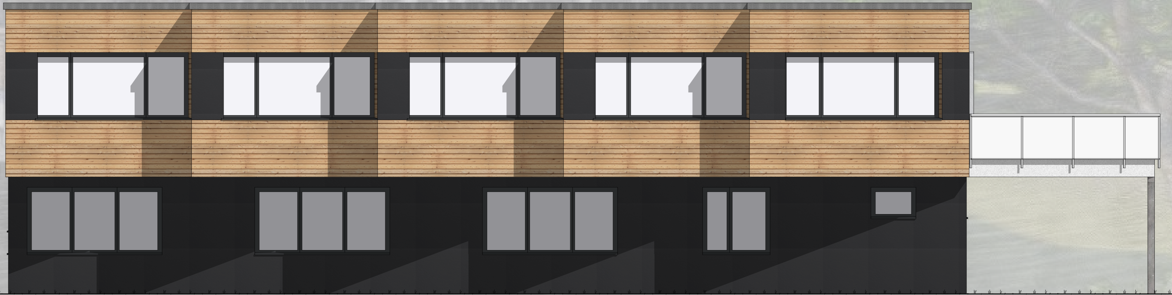
Ansicht WEST M 1:50