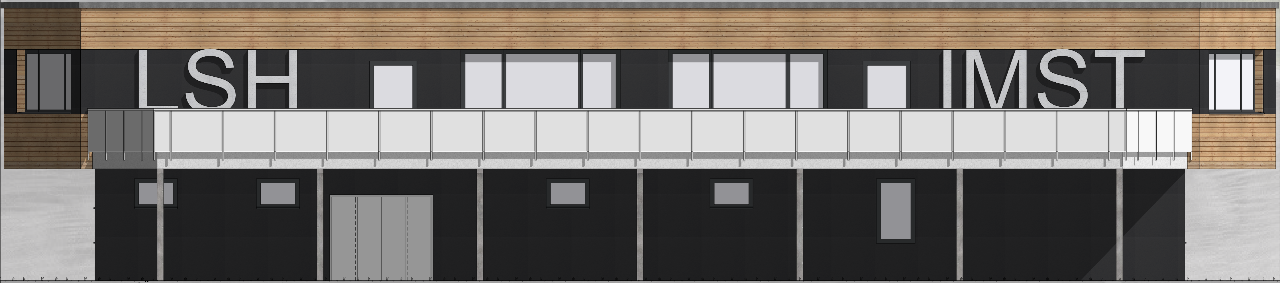
Ansicht SÜD M 1:50