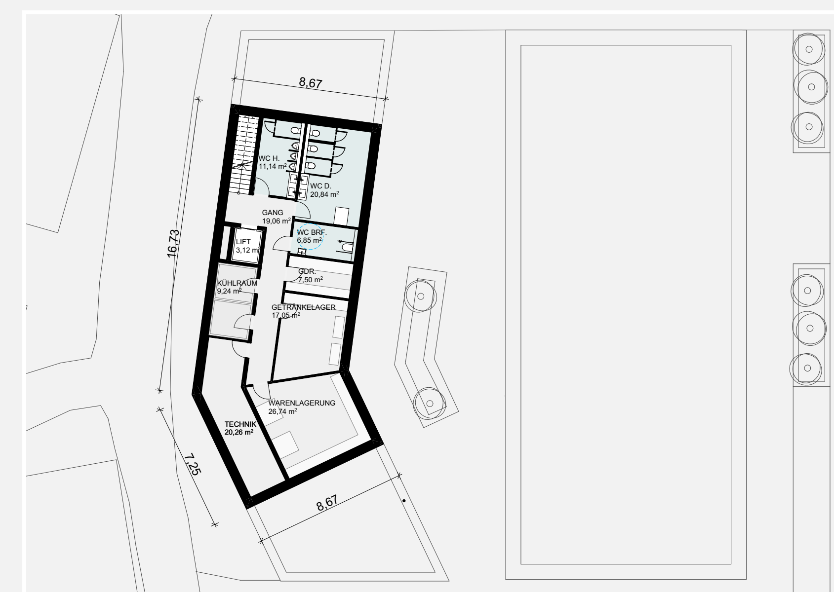
KELLERGEHOSS M 1:200