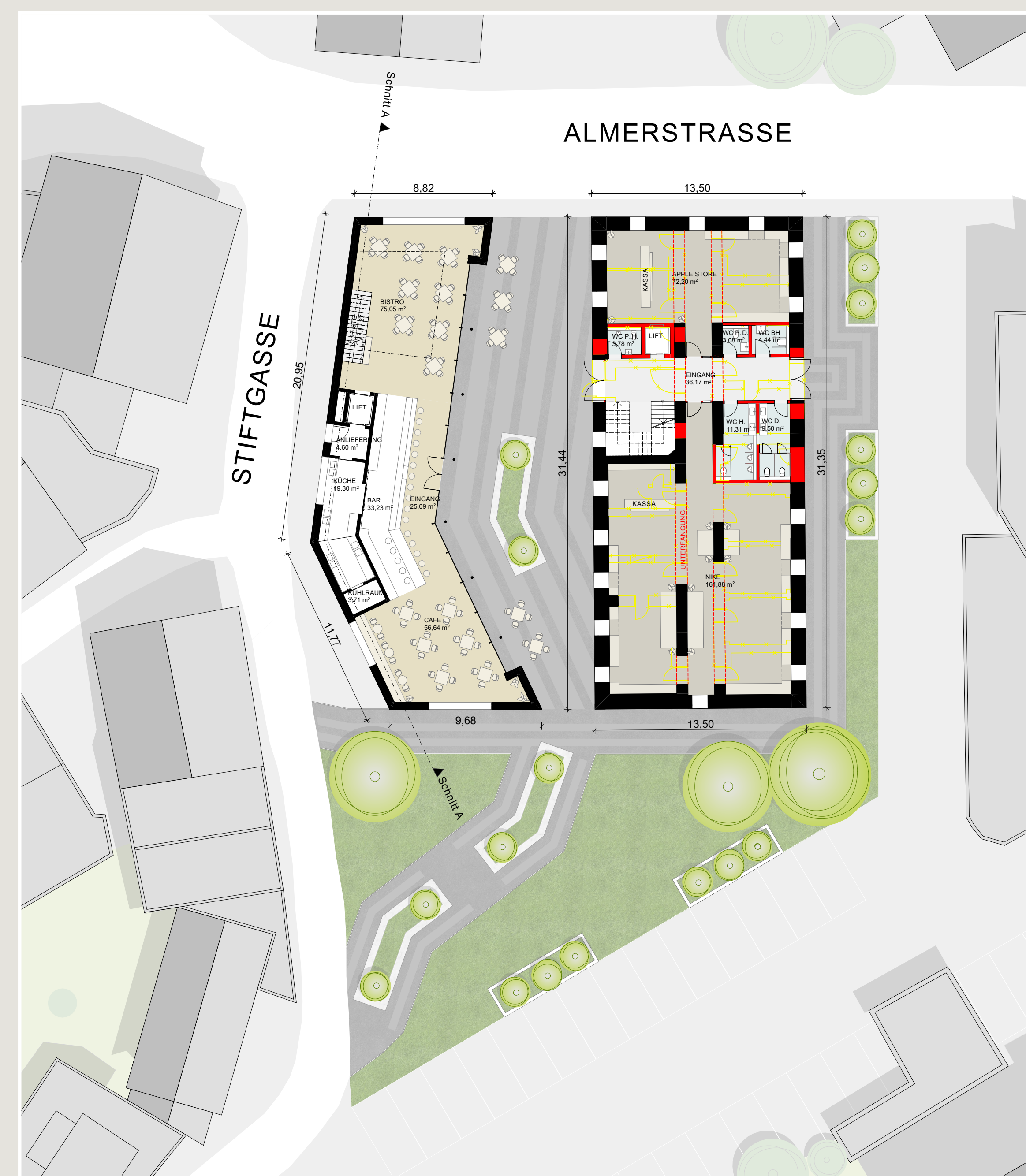
ERDGEHOSS M 1:200